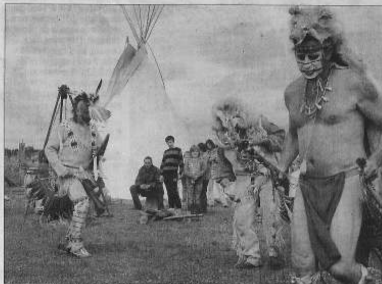
La pluie n'a pas résisté à la danse des indiens. Le public non plus.

Ce week-end a rassemblé indiens, cow-boys et plus largement, les curieux ainsi que les amoureux de la culture américaine. Qui a dit que la mode n'était plus au western ?