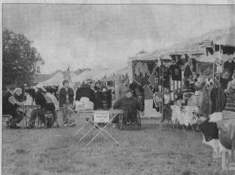
Tout était prévu : le public a pu ressortir de là, soit en cow-boy, soit en indien.