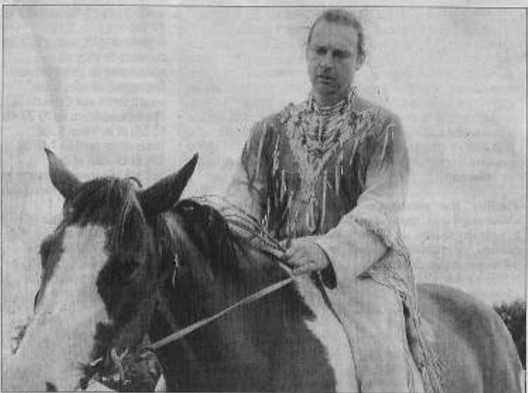
Ce cheval, particulièrement excité, a été dompté par la sagesse de cet indien.