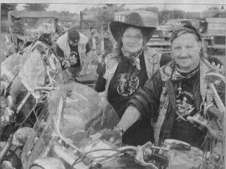
Les fans de grosses motos américaines étaient aussi au rendez-vous.