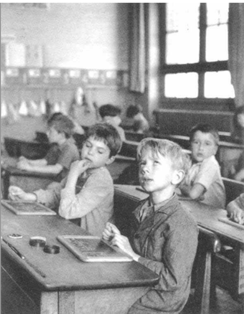
Célèbre photo de R. DOISNEAU

Sources : UNICEF, situation des enfants dans le monde en 2001