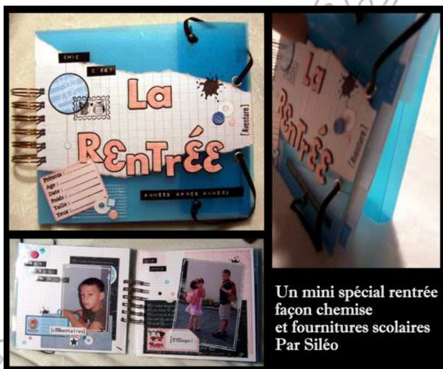
Un mini spécial rentrée façon chemise et fournitures scolaires Par Siléo

Bon niveau technique, rien d'extraordinaire du tout ! Et niveau fournitures scolaires voici ce qu'il vous faut :