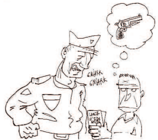
Partisan du port d'arme